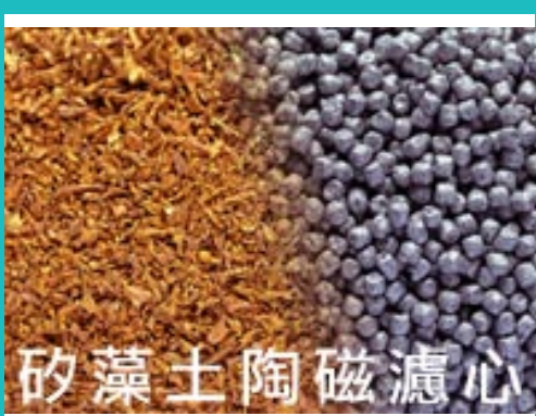
Diatomaceous ceramic filter