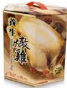
Health Stewed Chicken

採用特選全雞加上養生中藥料理而成，保留全雞精華與獨特風味，味甘而不膩，性溫不燥，最佳的養生極品，是您節日送禮的好選擇囉！