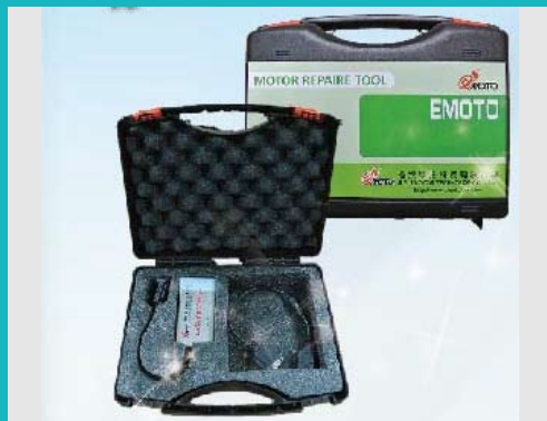
ETIPC Wireless PC-based Analyzer