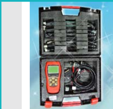
DL100 Data Recorder for Gasoline Direct Injection Engine

Ji Zhi Motor Technology Co., Ltd. specializes in developing auto/motorcycle repair and maintenance equipment to enable buyers to maximize profit margins, mainly offering injection system diagnostic systems and peripherals.